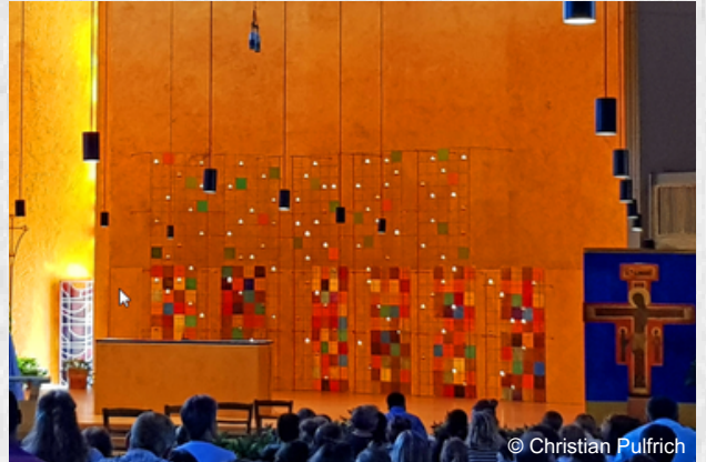
Das Bild auf der Vorderseite steht unter folgender Lizenz: www.creativecommons.org/licenses/by-sa/4.0 Es wurde zugeschnitten, aber ansonsten nicht verändert.

Welt zu Begegnung, Austausch und Gebet. Bist du zwischen 15 und 35 Jahren alt und möchtest Teil dieses Erlebnisses sein? Dann findest du hier noch mehr Infos und die Anmeldung , die bis zum 28.06. möglich ist.